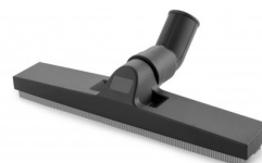
6010046 WATERAFTREKKER V340 Ø 36