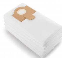
3001039 VLIESFILTERZAK 20L (10st)