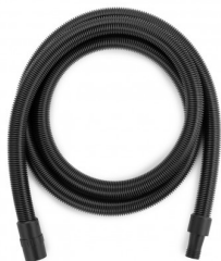
6010530 ANTISTATISCHE FLEXIBELE SLANG dia. 33 - 4 M