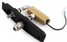
6689163 COMBI-KIT: PNEUMATISCHE AANSLUITING