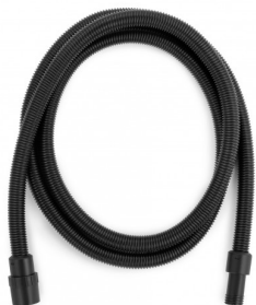
6010531 ANTISTATISCHE FLEXIBELE SLANG dia. 29 - 4 M