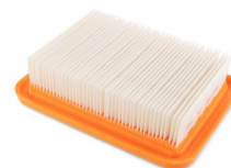
2512772 PTFE VLAKFILTER (M FILTRATIEKLASSE)