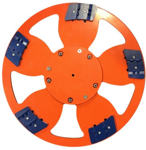
00-304 DRONE 5 DISK SCRAPER