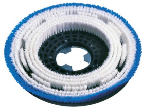
00-243 Tapijtborstel dia 430mm