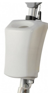
00-330 Detergent tank 12L