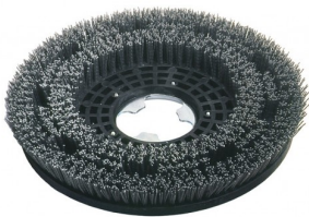
00-246 Tynex schrobborstel dia 430mm