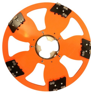
DRONE 5 DISK BLACK DIAMOND