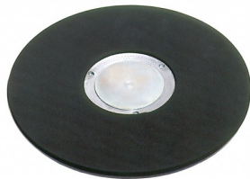
00-253 Schuurpapierhouder dia 405mm