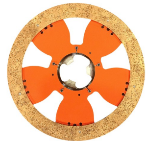
DRONE 5 DISK VIDIA RING