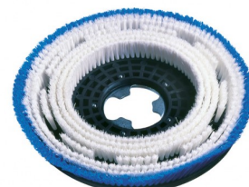
00-243 Tapijtborstel dia 430mm