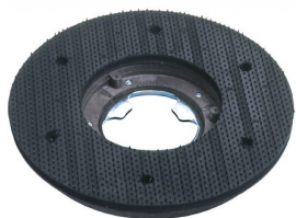
00-240 Padhouder dia 430mm voor 154-227 rpm