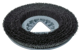
40.0208.00 BORSTEL TYNEX GRIT 240 0.9 DIA. 380