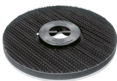
40.1008.00 Pathouder 355mm (voor pads 15")