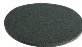
C15-GR GROEN NYLON PAD DIA 380 MM (per 6)