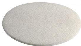
C15-WH WIT NYLON PAD DIA 380 MM (per 6)