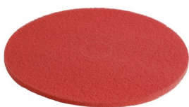
C15-RE ROOD NYLON PAD DIA 380 MM (per 6)