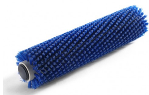
40.5000.00 CYLINDRISCHE BORSTEL IN POLYPROPYLEEN (blauw)