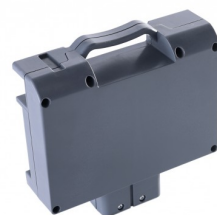
22.0508.00 BATTERIJPACK Li Fe P04 24V 10 AH