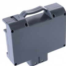
22.0508.01 BATTERIJPACK Li Fe P04 24V 20 AH