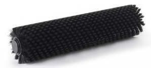
40.5000.03 CYLINDRISCHE BORSTEL IN TYNEX (zwart)