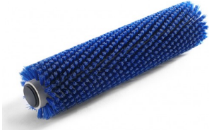
40.5000.04 CYLINDRISCHE MICROVEZEL BORSTEL