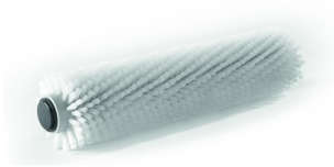
40.5000.01 ZACHTE CYLINDRISCHE BORSTEL IN POLYPROPYLEEN (wit)