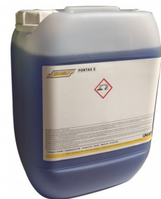
6500020 REINIGINGSZEEP 10L (ONTVETTEND)