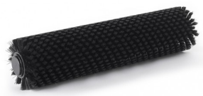
40.5000.02 HARDE CYLINDRISCHE BORSTEL IN POLYPROPYLEEN (zwart)