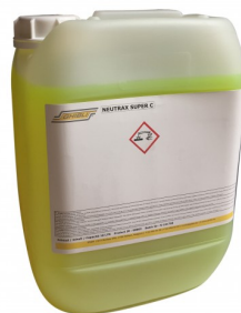
6500010 REINIGINGSZEEP 10L (GEUREND)