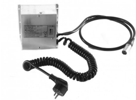
22.0619.01 BATTERIJLADER LiFe PO4 24V 10 A