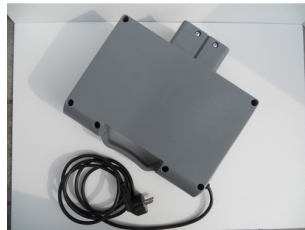
22.0509.00 VOEDING 24V