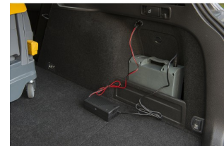
18.0065.00 AUTOLADER 24-12V 5A