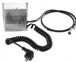
22.0619.00 BATTERIJLADER 24 V 5A