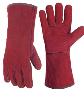
97326 Lashandschoenen (lang) MIG/MAG - elektrode