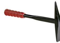
97318 Bikhamer Profi - massief staal