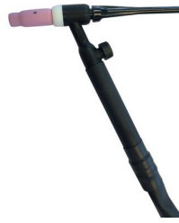
6037050 TIG TOORTS SR 26 V - T50 - 4M - MANUEEL GASKRAAN