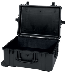
595077461 TROLLEY OP WIELEN - IP67