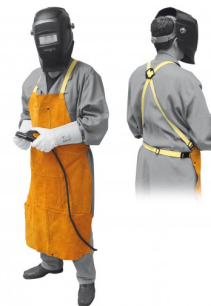
97575 LASSCHORT PROFI