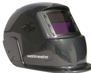
99964 Lashelm automatisch Weldmeister BASIC TRUE COLOR