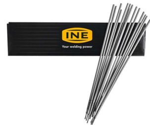
97160 Laselektroden RUTILE (staal) 3,25mm per 2,5kg (88 stuks)