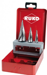
40663 Trappenboorset HSS Co5