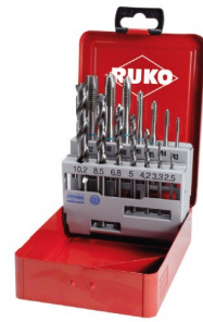
40670 Machinetappenset HSS