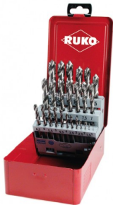
40677 Set spiraalboren DIN 338 type N HSS-G (25-delig)