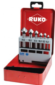
40664 Set verzinkboren C 90° DIN 335 HSS