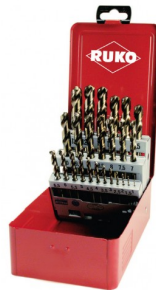
40678 Set spiraalboren DIN 338 type N HSS-G Co5 (25-delig)