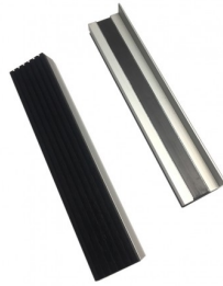
45230 Set zachte aluminium klauwen